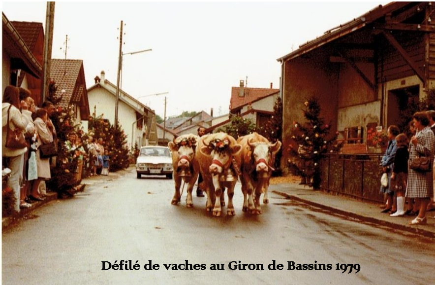
Défilé de vaches au Giron de Bassins 1979